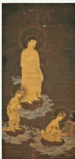
右：滋賀県指定有形文化財 阿弥陀三尊来迎図 鎌倉時代 滋賀光明寺 左：阿弥陀二十五菩薩来迎図 鎌倉時代 京都三千院【前期展示】