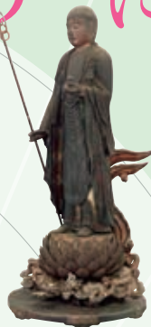
地藏菩薩立像 鎌倉時代 香雪美術館