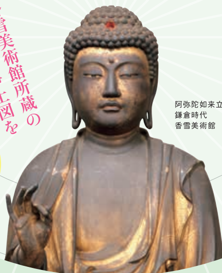
阿弥陀如来立像 鎌倉時代 香雪美術館

重要文化財 智光曼荼羅 鎌倉時代 文化庁 【前期展示】