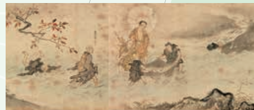
上：戯画図巻 伝 狩野探幽筆 江戸時代 香雪美術館 右：重要文化財 二河白道図 鎌倉時代 香雪美術館