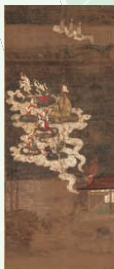
右：重要美術品 帰来迎図 南北朝時代 香雪美術館 左：阿弥陀三尊像 張思恭筆 南宋時代 京都永観堂禅林寺【後期展示】