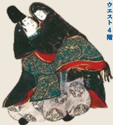
依屋宗達 伊勢物語図色紙 芥川【部分】大和文華館／後期展示 表面背景画：伊勢物語図色紙 香雪美術館

中之島 香雪美術館 Nakanoshima Kosetsu Museum of Art