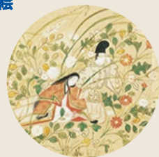
伊勢物語絵巻（小野家本）武蔵野【部分】個人蔵／巻替えあり