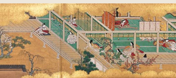
重要文化財 源氏物語絵巻（盛安本）末摘花巻【部分】石山寺／巻替えあり

しむと共に、香雪本の作風や制作時期について考えます。同時に、古来描き継がれた伊勢物語絵の変遷にも目を向けます。千年以上も愛され続けた、絵になる男の人生を楽しんでいただけると幸いです。 なお、特別陳列として「幻の源氏物語絵巻」と呼ばれる「源氏物語絵巻（盛安本）」を、近年その全文が発見された「賢木巻」詞書を中心に紹介します。