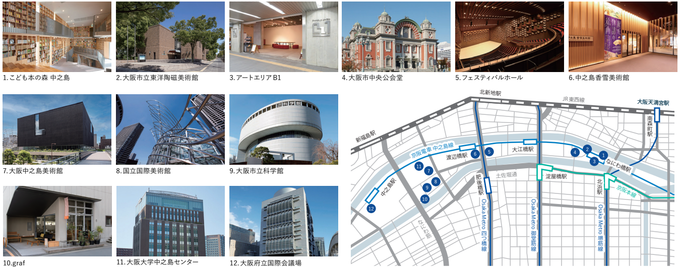
1. 子どもの森 中之島

「クリエイティブアイランド中之島」は、14 機関による国内最大規模の創造ネットワーク組織が、中之島エリア全体をユニークベニューとしての「創造的な研究所」に見立て、様々なクリエイティブコンテンツを開発・創出していきます。