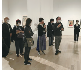
※写真は昨年度開催の様子

中之島を活動拠点の1つとした美術家集団「具体美術協会」をテーマにした企画展が、大阪中之島美術館と国立国際美術館で開催されています。両館の担当学芸員が展覧会のみどころや、共同企画に至る道のりなどを語ります。展覧会は、参加者のみなさんとめぐる“プレ・ツアー”か、トーク前や後日の個別鑑賞のいずれかからお選びください。特別な美術館の夜をお楽しみください。