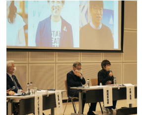
※写真は昨年度開催の様子

私たち一人ひとりには「人生100年時代」における社会人の学び直し「リカレント教育」や、理系や文系の枠を超えて課題発見・解決力や創造力を育む「STEAM教育」など、学びのあり方や可能性が広がっています。多様な知が集い、新たな価値を創出する知の活力を生む、総合知につながる機会として、学び続けられる社会についての対話を繰り広げます。