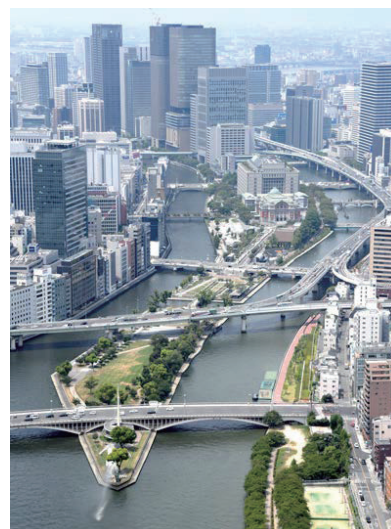
(協力：中之島まちみらい協議会)

2022年度は、ナイトミュージアムや船のクルージング、貸切電車企画を中心とした4つのプログラムを実施。クリエイティブアイランド中之島の取り組みを内外に発信していきます。