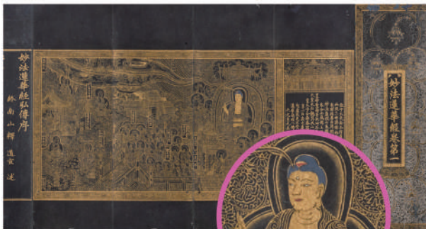
京都府指定文化財 《法華経》の5ち巻第一 朝鮮・至元5年(1339) 京都・妙顕寺蔵 【前期】