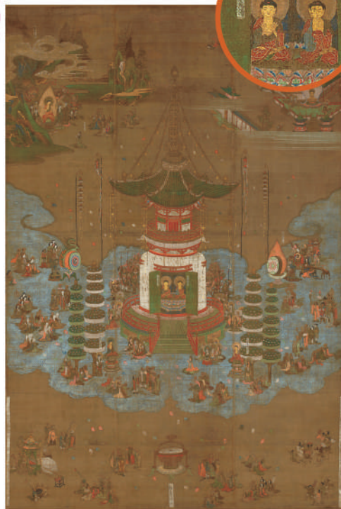
重要文化財 《法華経曼荼羅》の5ち見宝塔品 鎌倉時代 富山・本法寺蔵 【後期】