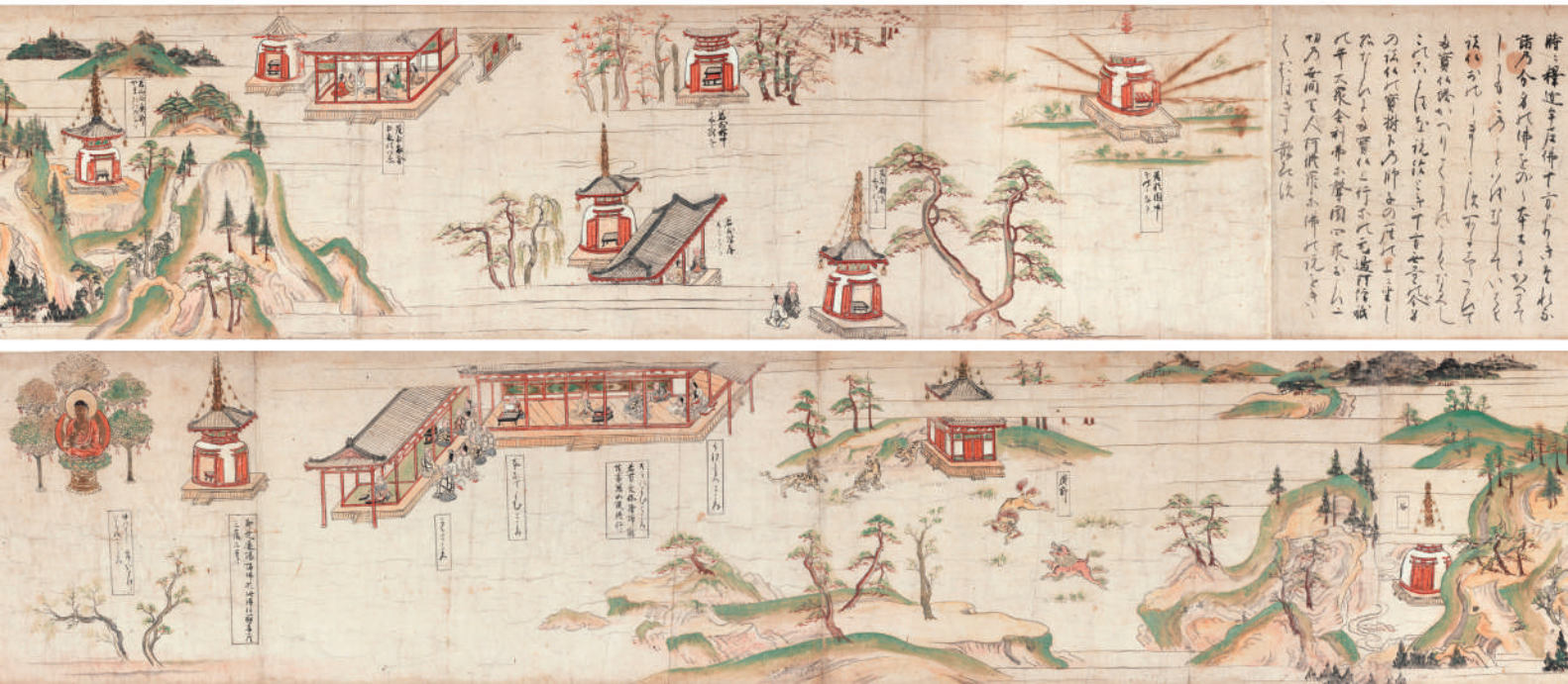
重要文化財 《法華経絵巻》 鎌倉時代 香雪美術館蔵